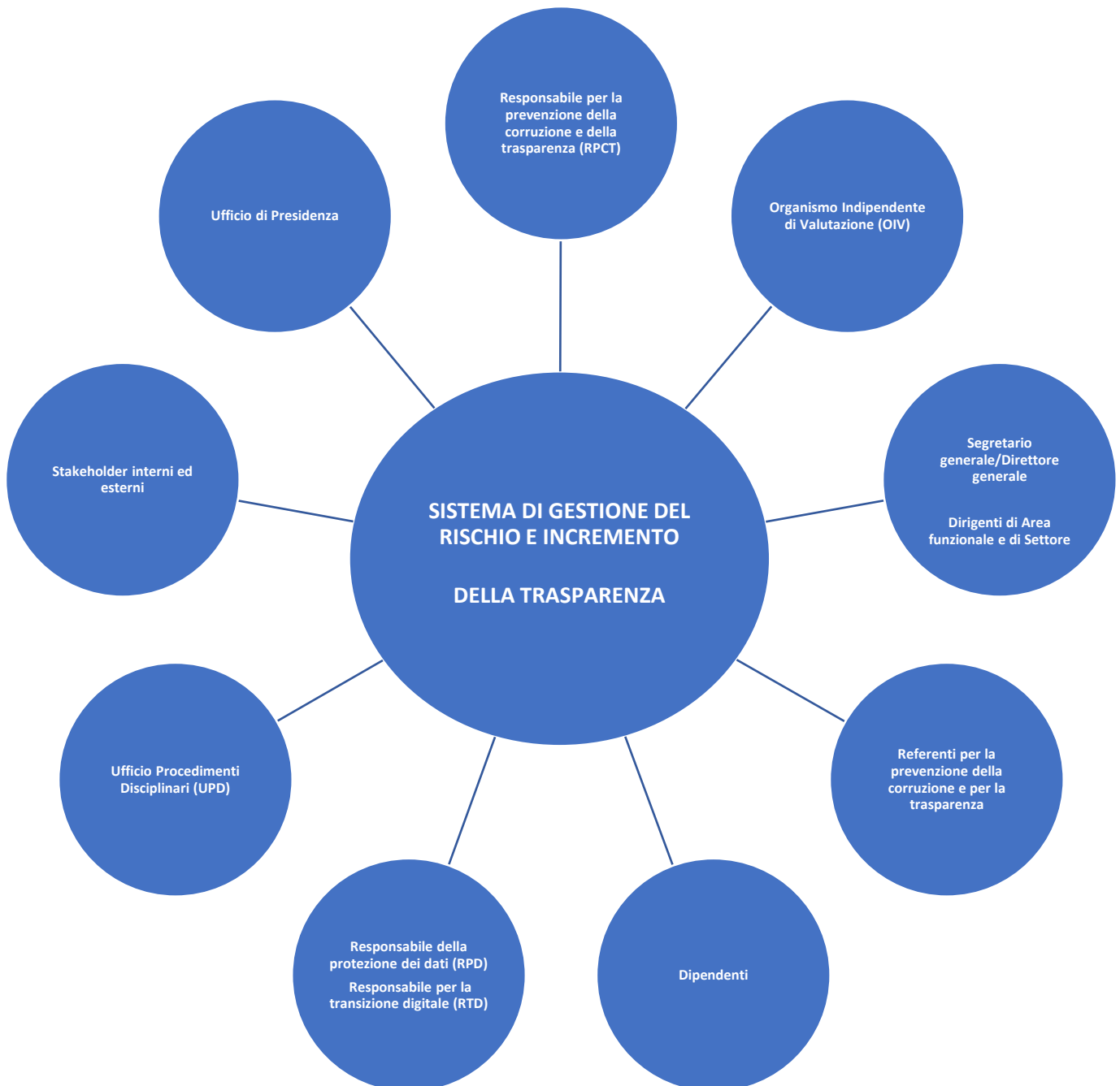
Figura 1 – Gli attori del processo di gestione del rischio corruzione