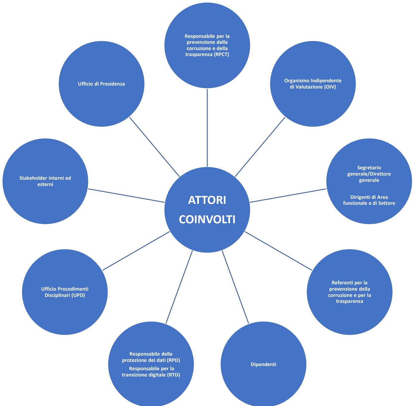
Figura 1 – Gli attori del processo di gestione del rischio corruzione