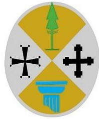
Tabella n. 1

(Art. 3 della Legge di Assestamento del Bilancio di previsione della Regione 2023-2025)