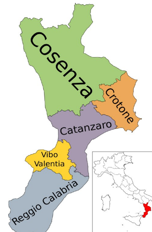
PIANO REGIONALE GESTIONE RIFIUTI

Linea di intervento/Attività 3 - "Adozione di Piani di gestione adeguati alla normativa (rifiuti)"