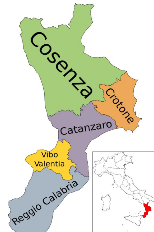
PIANO REGIONALE GESTIONE RIFIUTI

Linea di intervento/Attività 3 - "Adozione di Piani di gestione adeguati alla normativa (rifiuti)"