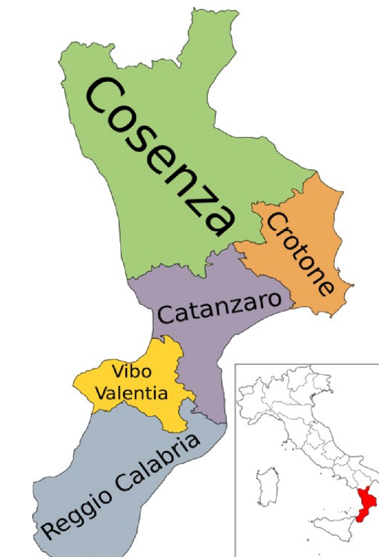
PIANO REGIONALE GESTIONE RIFIUTI

"Rafforzamento delle Autorità Ambientali" Linea di intervento/Attività 3 - "Adozione di Piani di gestione adeguati alla normativa (rifiuti)"