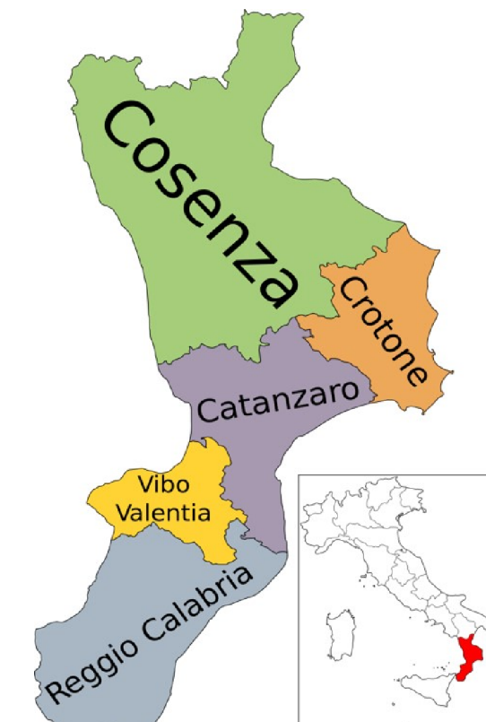
PIANO REGIONALE GESTIONE RIFIUTI

Linea di intervento/Attività 3 - "Adozione di Piani di gestione adeguati alla normativa (rifiuti)"