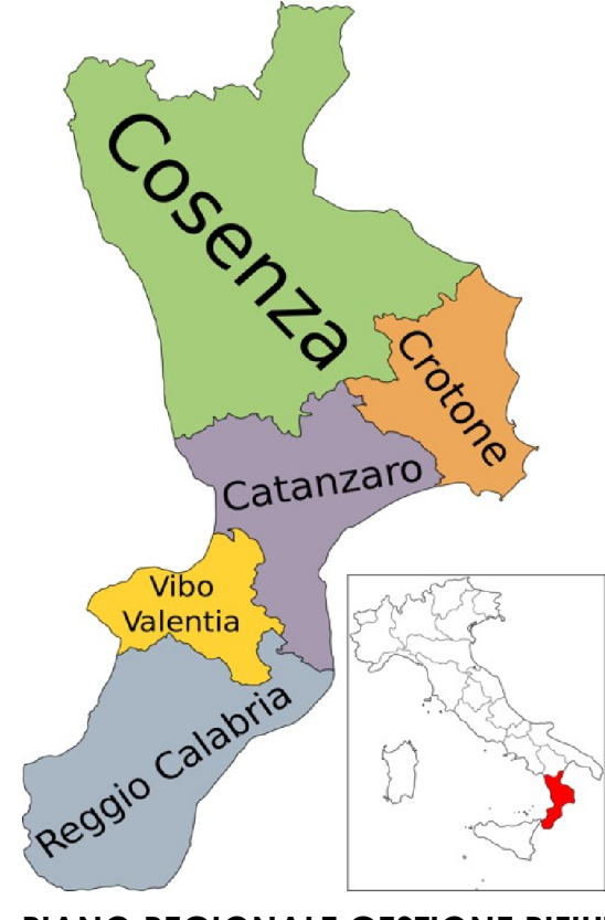
PIANO REGIONALE GESTIONE RIFIUTI

"Rafforzamento delle Autorità Ambientali" Linea di intervento/Attività 3 - "Adozione di Piani di gestione adeguati alla normativa (rifiuti)"